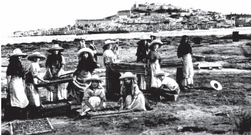
Ibiza (Eivissa), c. 1930.

Sve se menja i zamenjuje mesta; ništa ne ostaje i ništa ne nestaje. Iz celog tog tkanja, međutim, odjednom izranjaju imena; bez reči ulaze u misli prolaznika i dok ih oblikuje usnama, on ih prepoznaje. Izlaze na površinu. Šta bi još mogao očekivati od tog predela? Ona prolaze pokraj njega na dalekom, bezimenom horizontu, ne ostavljajući za sobom ni traga. Imena ostrva, koja izranjaju iz mora kao mermerni kipovi, okomite stene, čiji vrhovi krune horizont, zvezde koja ga iznenade u čamcu, kada s prvim mrakom izađu na stražu. Pisma zrikavaca je utihnula, žeđ je prošla, dan se gasio. Iz dubine polja se podiže neka larva. Lavež, odron kamenja, dozivanje iz daljine? Dok osluškuje, pokušavajući da odgonetne taj zvuk, u njega počinje da se uvlači brujanje zvona, notu po notu. Onda ga obuzima i širi se u njegovoj krvi. Ljiljani koji cvetaju u uglu živice od kaktusa. U daljini, bešumno truckanje neke zaprege, koja ide poljem između stabala maslina i badema; a kada točkovi nestanu iza lišća, žene, veće od života, lica okrenutih ka njemu, kao da lebde, nepomične, u nepomičnom predelu.