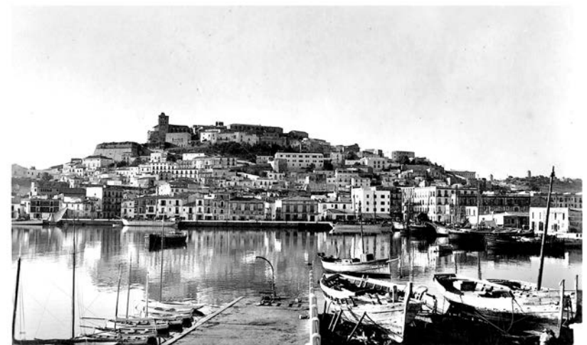
IBIZA (Balears) Vista de la Ciudad