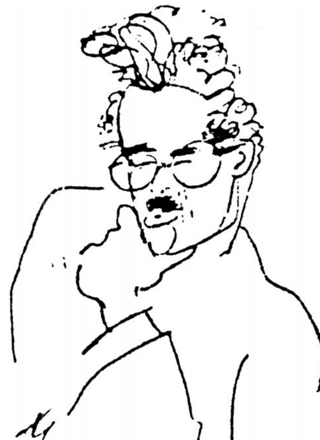
WB, crtež B. F. (Benedikt Fred) Dolbin, c. 1930.

http://anarhisticka-biblioteka.net/category/author/walter-benjamin