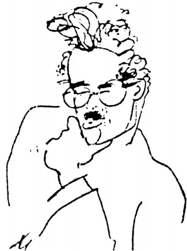
WB, crtež B. F. (Benedikt Fred) Dolbin, c. 1930.