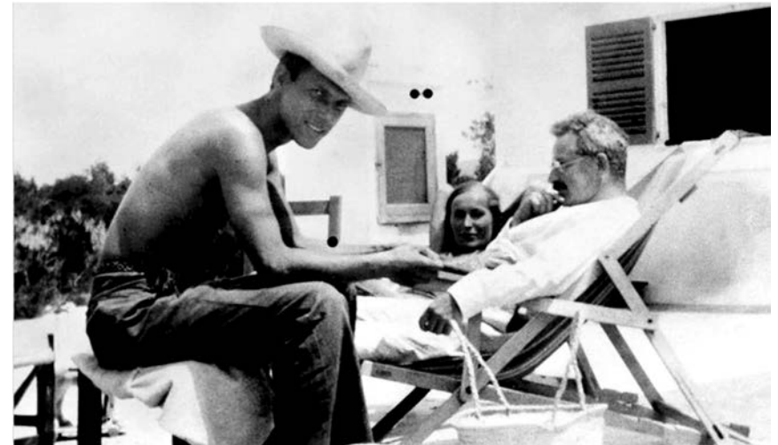
Walter Benjamin, Jean i Guyet Selz, Ibiza-Eivissa, San Antonio, 1932.

okreće argumentaciju naglavačke i nudi tvrdnju po kojoj je postao slavan: iz tog novog siromaštva ne izvire očajanje već novo varvarstvo. Sa iskustvom siromaštva, novo varvarstvo kreće iz početka i, u otporu prema svemu jalovom i krivotvorenom, gradi na minimalnim temeljima (...)