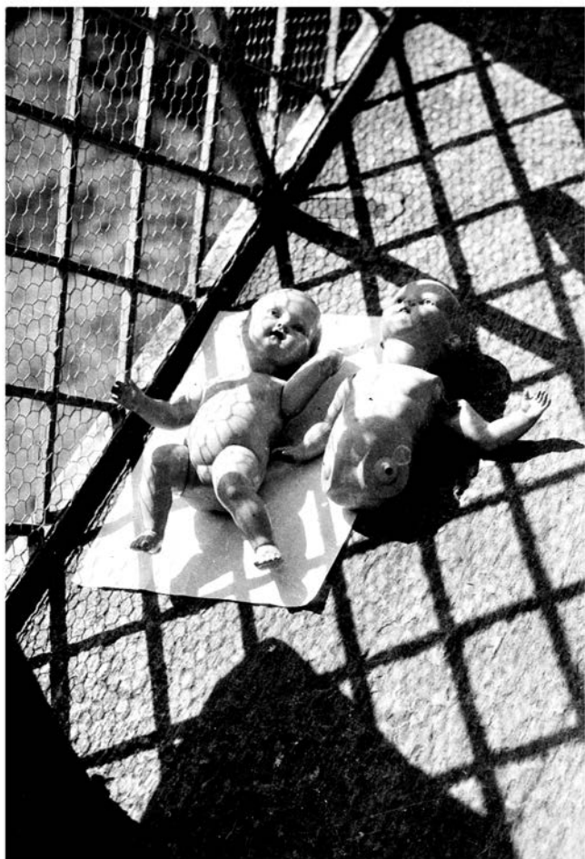
Na koricama: pogled s glavnog stepeništa zgrade Bauhauusa (Dessau), Bauhausbücher no. 12, München 1928, str. 55. Gore: Laslo Moholji Nađ, „Lutke“ ili „Lutke na podnevnom suncu“, „Lutke se sunčaju“ (László Moholy-Nagy, „Puppen in der Mittagssonne“; „Puppen im Sonnenbad“, 1926), Bauhausbücher no. 8, 1927, str. 90.