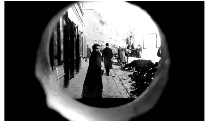
Stereoskopska fotografija iz varšavskog „Fotoplastikona“ (1905?).