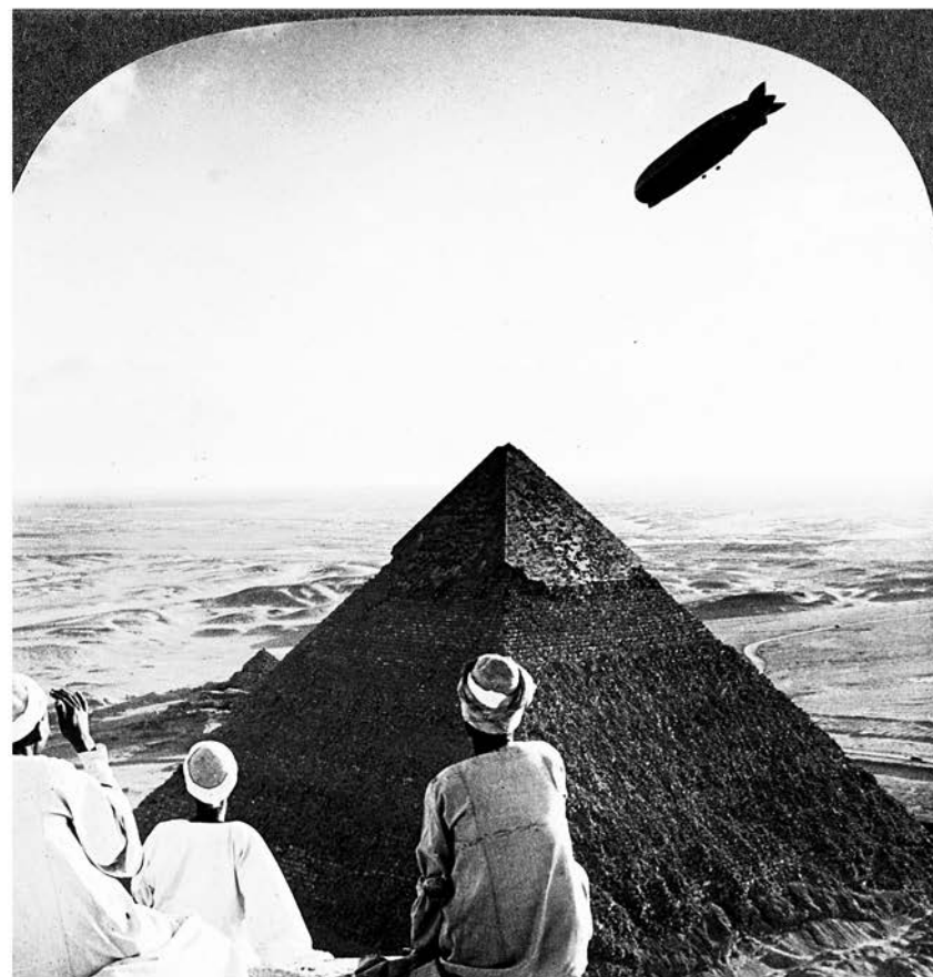
Einbahnstraße , 1928, S. 18–26.