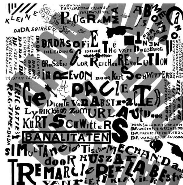
Theo van Doesburg, Kurt Schwitters, Kleine Dada Soirée , 1922.