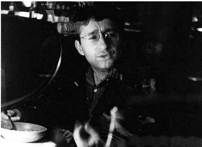
Guy Debord, 1962.