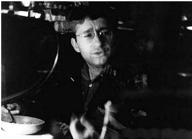
Guy Debord, 1962.