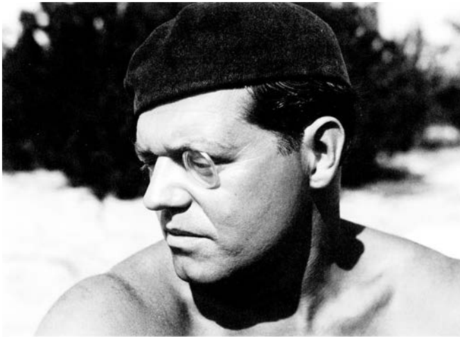
Raoul Hausmann, 1930.