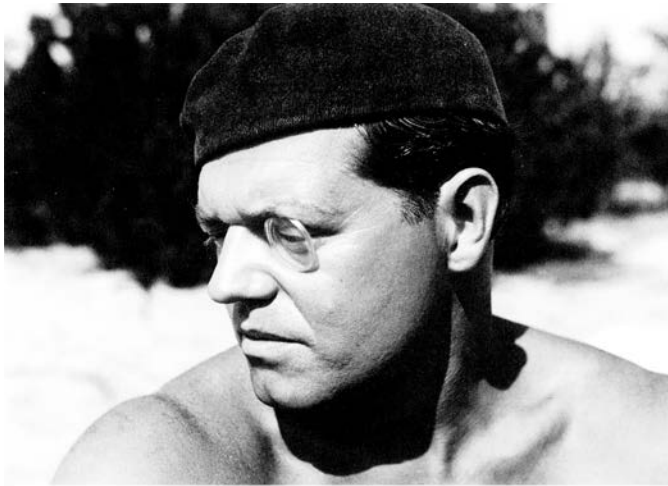
Raoul Hausmann, 1930.