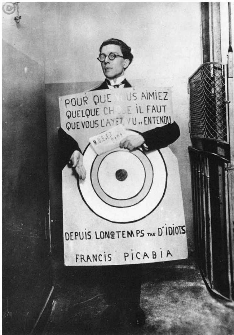
DVADESET TRI MANIFESTA POKRETA DADA Littérature br. 13 Pariz, maj 1920.