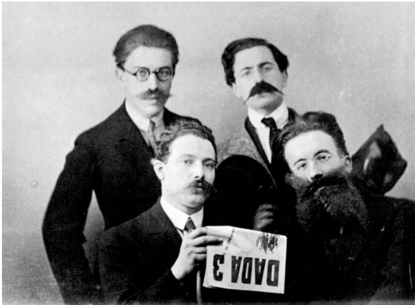
André Breton, René Hilsum, Louis Aragon, Paul Eluard, 1919.

Ovo je prevod kompletnog broja 13 časopisa Littérature (urednici Andre Breton, Luj Aragon, Filip Supo), u kojem su objavljena „Dvadeset tri manifesta pokreta DADA“. To je bila „prva“ serija tog časopisa – od 1919. već dadaističkog (i pre Carinog dolaska u Pariz, u januaru 1920) – koja se od ostalih dadaističkih publikacija razlikovala i po tome što u njoj skoro da nije bilo ilustracija, osim nekih čisto tipografskih (što ovde nismo sledili). Pošto su tri manifesta Tristana Care i jedan manifest Žana Hansa Arpa već prevedeni i objavljeni u bukletima (fajlovima) s njihovim tekstovima, ti manifesti su samo naznačeni, tamo gde su se pojavili u časopisu, a umesto njih su ubačena četiri druga teksta – tri manifesta, kasnije često citirana, i jedan tekst koji ilustruje poziciju dadaista na nešto širem planu: