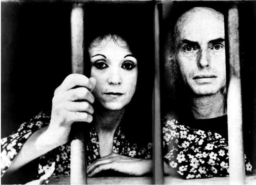
Judith Malina i Julian Beck, u zatvoru u Belo Horizonte, Brazil, 1971.

Forma će se nametnuti u procesu. Osoba koja najmanje govori možda je osoba koja nadahnjuje onu osobu koja najviše govori. Na kraju nitko ne zna tko je doista bio odgovoran za što, individualni ego se izgubio u mraku, svatko doživljava zadovoljstvo, svatko doživljava veće osobno zadovoljstvo no što je zadovoljstvo usamljenoga „ja“. Jednom kad to osjetite – proces umjetničkoga stvaranja u kolektivu – povratak na stari poredak čini se nazatkom.