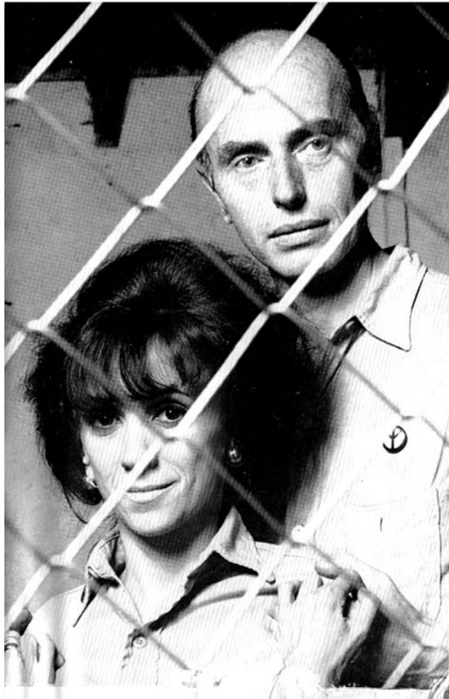
Judith Malina i Julian Beck, u vreme predstave The Brig (Zatvor), 1963.