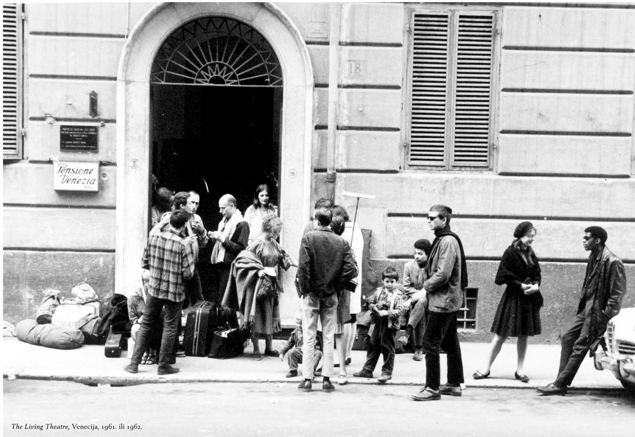
The Living Theatre, Venecija, 1961. ili 1962.