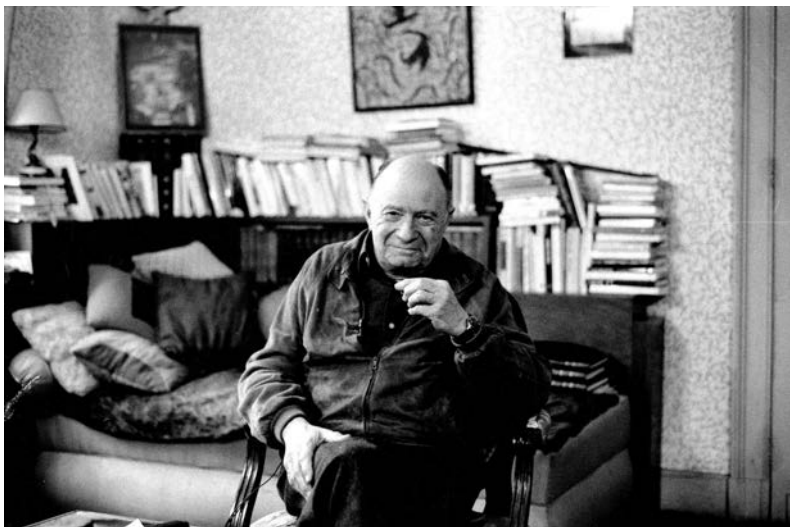
Žak Elil, u svojoj kući u Pesaku (Pessac), nadomak Bordoia, za vreme snimanja dokumentarca Tehnička obmana , 1990 (1992).