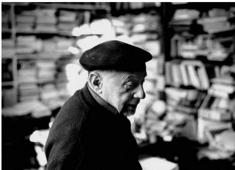
Jacques Ellul (1912–1994)

JACQUES ELLUL (ŽAK ELIL), OSTALI PREVODI I IZVORI: