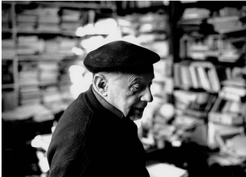
Jacques Ellul (1912–1994)

Jedva da znam za neki biblijski tekst koji rad predstavlja kao nešto dragoceno, dobro ili čestito. To se mora jasno reći. Rad je u Bibliji nužnost, prinuda, kazna, osim u svega nekoliko netipičnih tekstova. Naravno, svakome je poznata priča iz Knjige postanja (2:15), 1 u kojem se čovečanstvo, pre raskida s Bogom, poziva da obrađuje zemlju i čuva Rajski vrt. Tako smo dobili celu armiju teologa koji u tom tekstu vide izvor rada i koji na osnovu njega tvrde kako raspoložu dokazom da je rad deo ljudske „prirode“. Ono na šta bih hteo da ukažem, međutim, jeste paradoks da prema tom izvornom shvatanju rad nema nijednu od tih karakteristika! Istina, nalaže se obrađivanje zemlje, ali od toga ima malo koristi, zato što Vrt već cveta, sam od sebe, bez neke naročite ljudske pomoći. Pored toga, Vrt treba i „čuvati“; ali, od koga? Nećemo ulaziti u raspravu o preegzistenciji zla u stvaranju; od takvog zla, u Bibliji ne vidim ni traga. Tu nema neprijatelja, nema „načela zla“, nema Sotone. Tu je samo jedna zmija, ne neka mitska ili metafizička zmija, već prosto zmija, životinja. Ipak, Adamu je rečeno da obrađuje zemlju i da je čuva, da se bavi savršeno beskorisnim i nepotrebnim poslovima. To nije ni zakon, ni prinuda, niti nužnost. U isto vreme, razlika između takvih aktivnosti i igre još uvek ne postoji. Ne možemo govoriti o radu , u uobičajenom smislu.