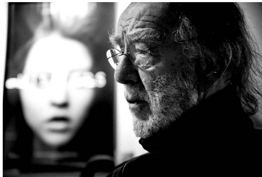
G. Reggio, New York, januar 2014.

REGGIO: Ne, nisam bio. Nisam nikada bio takav, zaista. Ja sam veoma neurotična osoba. Nekako sam i spiritualna osoba, ali mislim da to nije isto što i religioznost. S druge strane, mislim da je svakome od nas potrebna zajednica, a religija je stvar zajednice. To nije stvar dogme već življenja u zajednici s drugim ljudima, s ljubavlju kao glavnom sponom. Po meni, ono što jesmo jeste naša duša. U tome je stvar i sa muzikom. Muzika je gospa Atmos; to je ezoterično ime atmosfere. To je ono što udišemo, što nas okružuje. Dolazim iz Nju Orleansa, kao dete i adolescent rastao sam uz muziku, sve do trinaeste godine, kada sam napustio dom. To je ono što čini duh. Sada bih hteo da postavim jednu zagonetku: mi smo, u isti mah, i duh i materija. Siguran sam da duh prati materiju, ali mi smo nešto daleko više od svoje materijalnosti, nosimo još nešto duboko u sebi, što nazivamo „dušom“ ili kako je kome drago. Hoću da kažem, nije važno kako to zovete, zato što je to, u krajnjoj liniji, s one strane... to