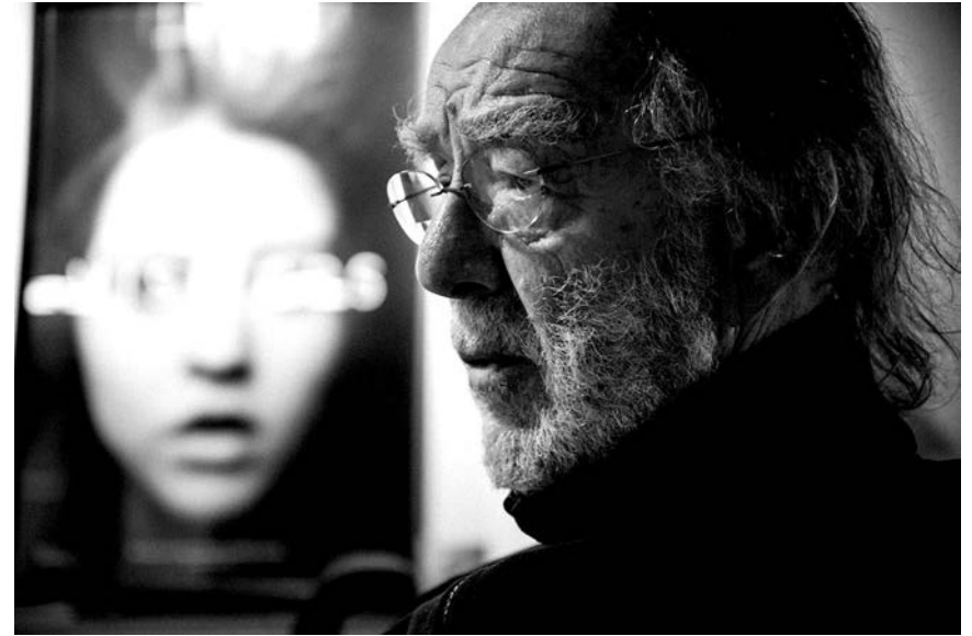
G. Reggio, New York, januar 2014.

nije nešto nerazumno već s one strane razuma. Mislim da naš um može da shvati otprilike ovoliko (pokazuje prstima nešto sićušno) u poređenju s beskonačnom mogućnošću. Misliti kako se umom može obuhvatiti celina onoga što se dešava je čista oholost.