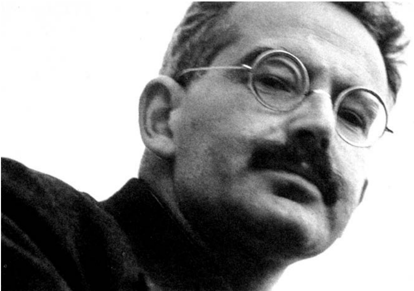
Walter Benjamin, Paris, 1937.