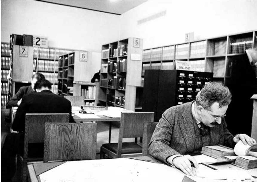
Walter Benjamin, Bibliothèque Nationale, foto Gisèle Freund, Paris, 1937.