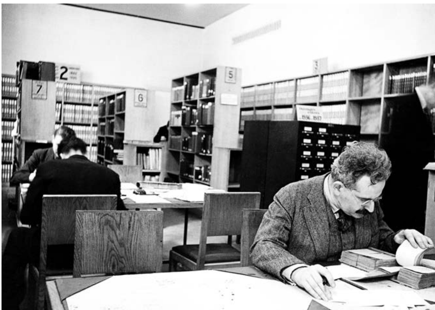
Walter Benjamin, Bibliothèque Nationale, Paris, 1937.