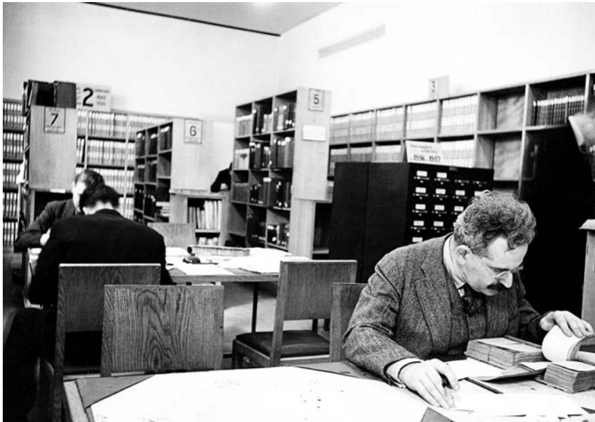
Walter Benjamin, Bibliothèque Nationale, Paris, 1937.