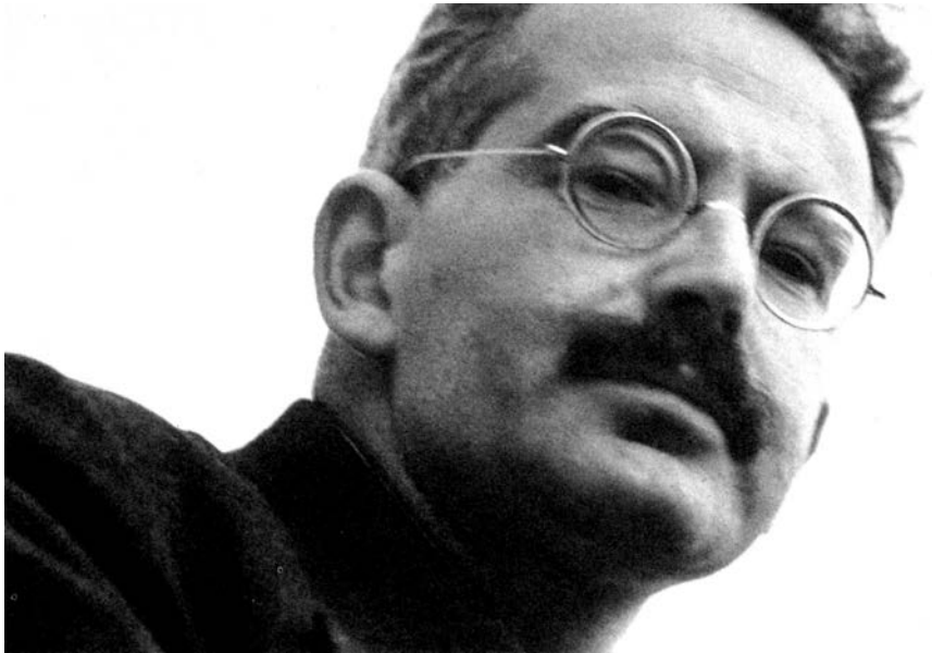
Walter Benjamin, foto Gisèle Freund, Paris, 1937.

što obično nazivamo filozofijom. Adorno je još 1955. 3 ponudio snažnu korekciju tog utiska: pokazao je da je svaki komad Benjaminovog kulturološkog kriticizma bio u isti mah „filozofija svog predmeta“. Počevši od 1924, Benjamin je analizirao širok spektar kulturnih predmeta, bez kvalitativne podele na visoko i nisko, i obično za temu uzimao „nase“ istorije, to jest, zapostavljene i neupadljive ostatke iščezlih miljea i zaboravljenih događaja. Bio je usredsređen na marginalno, na anegdodu i tajnu istoriju. S druge strane, nikada se nije odrekao standarda veličine. Prvi trag u evropskoj književnosti ostavio je sa esejom o Geteu, da bi se kasnije redovno osvrtao na neke istaknute savremenike, kao što su Prust, Kafka, Breht i Valeri, i svoje raznovrsne studije Pariza iz sredine XIX veka fokusirao na Bodlerova epohalna ostvarenja. Takvi reprezentivni umetnici bili su zvezde vodilje njegove mikrološkičke kultureloške analize. Naime, njegovu misao je usmeravao osećaj za celinu, koja se otkriva samo kroz uranjanje u gravitaciono polje nekog rečitog detalja, kroz opažanje koje je u istoj meri individualizujuće i alegorijsko.