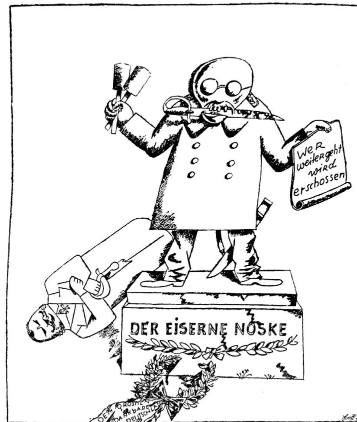
George Grosz, „Gvozdeni Noske“. Na papiru koji drži u ruci ispisa- no je njegovo čuveno naređenje: „Svako ko se kreće biće streljan.“

Das Gesicht der herrschenden Klasse: 57 politische Zeichnungen von George Grosz, Berlin, Malik-Verlag, novembar 1921.