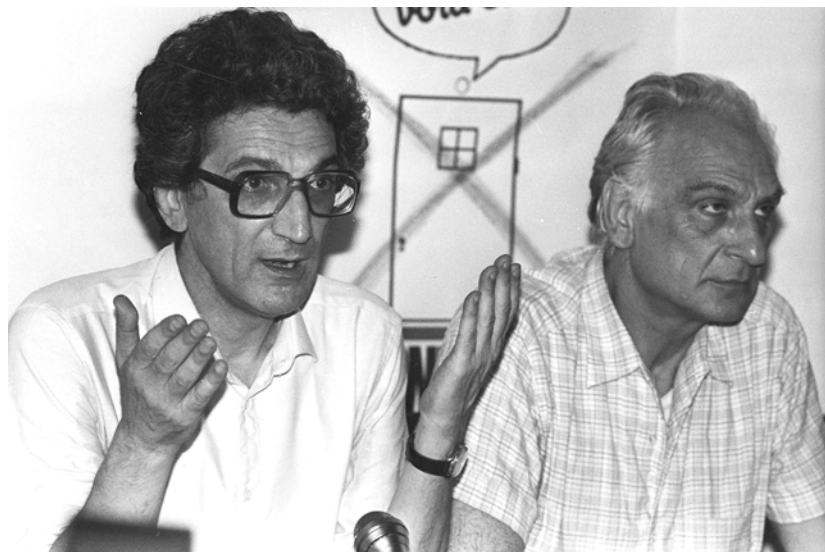
A. Negri i Marco Pannella, lider Radikalne partije (Partito Radicale), 1983.

čela sudska odiseja Tonija Negrija, koji je 7. aprila 1979. bio uhapšen s još nekoliko desetina aktivista, u policijskoj akciji usmerenoj na šire okruženje Radničke autonomije. Podignuta je optužnica zbog subverzivnog udruživanja i povezivanja u oružanu grupu, ali u narednih nekoliko meseci, optužnice protiv Negrija počele su da se umnožavaju, sve dok nisu uključile i pobunu protiv države, kidnapovanje i ubistvo demohrišćanskog lidera Alda Mora i još 17 ubistava (te optužbe su bile povučene u narednih nekoliko godina). Bile su to godine u kojima su „priznanja“ pokajnika i posebni zakoni koje je inicirao ministar unutrašnjih poslova Kosiga, napunili zatvore hiljadama aktivista, što je izazvalo snažne društvene tenzije.