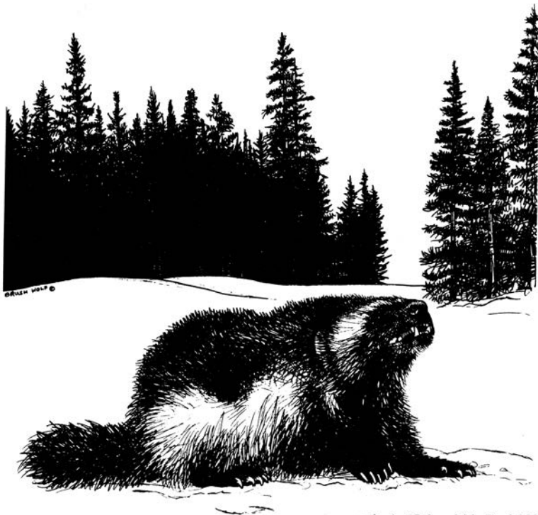
wolverine (Gulo gulo) by Brush Wolf

I taman kada je pomislio da dignu ruke od svega Muskrat izroni iz vode. Usta su mu bila puna zemlje, tako da nije mogao ni da govori, niti