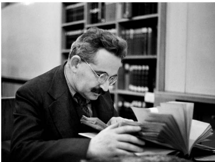
Gisèle Freund: Walter Benjamin, u nekom od kabineta Bibliothèque Nationale de France (BnF), u Parizu, 1937.