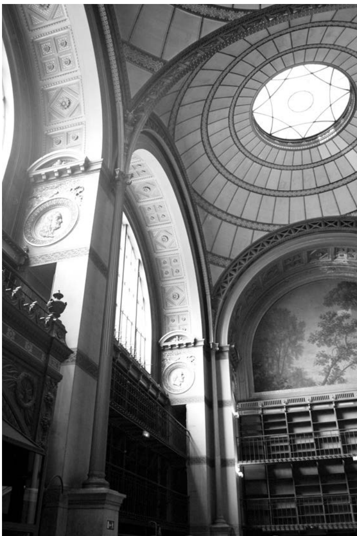
BnF, Salle Labrouste