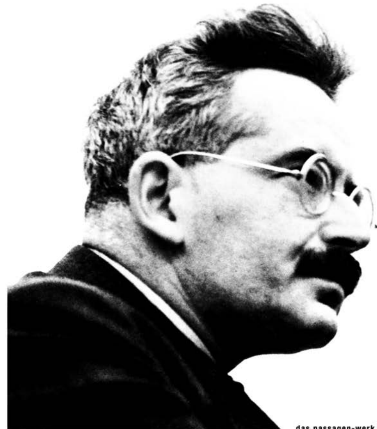
das passagen-werk 1927–1940