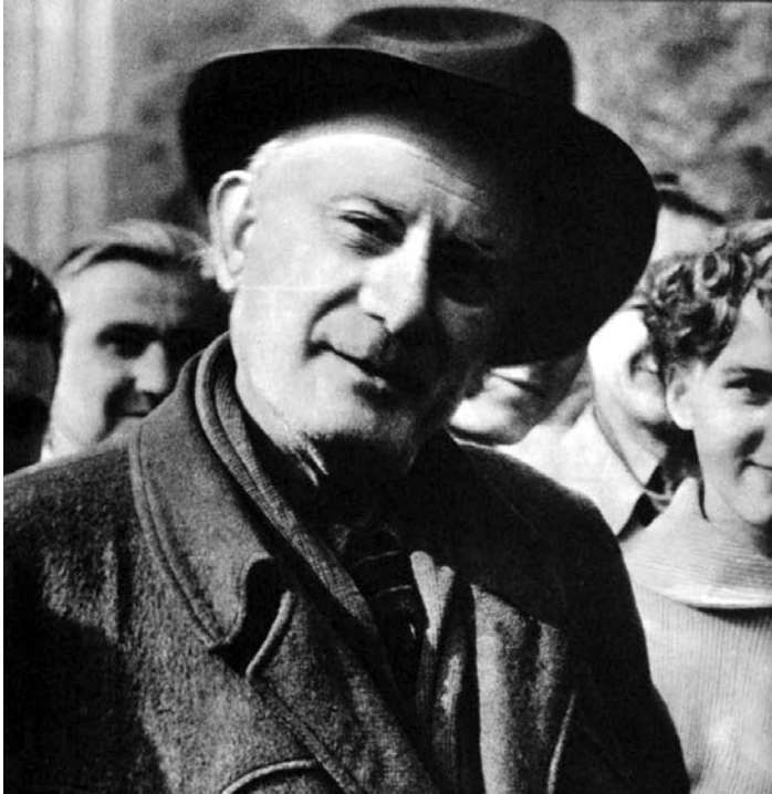
Tin Ujević (1891–1955)

Nalazim se na jadranskim Filipinima. Američani ne mogu naći ljepšu vedrinu na Havajima nego ja ovdje. Nalazim se u dubokom srcu dubokoga mora. Ovamo su me odista vile donijele, u nepoznatom nadnevku kada je globus zadrijemao i nitko nije mogao da me primijeti. Ja sam u carstvu pustolovina, u čudu događaja. Konačno sam doživio da je svijet zaboravio. I postao sam vlasnik jednog otajstva. Otputovao sam ravno prema pravoj slobodi, na jadranski front, na domaku Monte Gargana. I našao sam prije spontan, bolji nego da predstavljam svjetski PEN-club. Badava je to govoriti: Dalmacija, Jadran. Nego ovamo treba dohrliti, na Vis, kamo je stiglo dosta malo Čehoslovaka, i još dalje, na Biševo, na Svetog Andriju, na Palagruž. Poslije toliko godina tromerivnosti konačno me zahvatio talas epopeje. I to tako neodoljivo da će sada sva srca sa mnom zatreperiti, da će me svaka ljepota zavoljeti i blagosloviti.