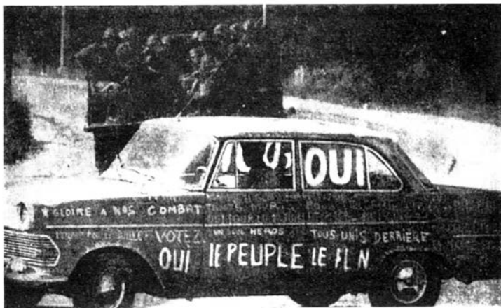
L'Algérie et l'écriture.

način. To je, u isto vreme, manifest i primer onoga što manifest nastoji da postigne. On se mora prihvatiti ili u vlastitim okvirima ili nikako.“ — Profesor Bolton