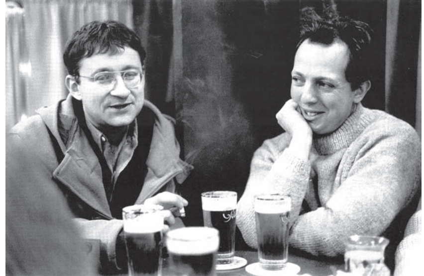
Guy Debord i Raoul Vaneigem, Pariz, 1962.

Le pouvoir donne seulement la fausse carte d'identité des mots; il leur impose un laisser-passer, détermine leur place dans la production (où certains font visiblement des heures supplémentaires); leur délivre en quelque sorte leur bulletin de paye. Reconnaissons le sérieux du Humpty-Dumpty de Lewis Carroll qui estime que toute la question, pour décider de l'emploi des mots, c'est « de savoir qui sera le maître; un point c'est tout ». Et lui, patron social en la matière, affirme qu'il paie double ceux qu'il emploie beaucoup. Comprenons aussi le phénomène d' in-soumission des mots , leur fuite, leur résistance ouverte, qui se manifeste dans toute l'écriture moderne (depuis