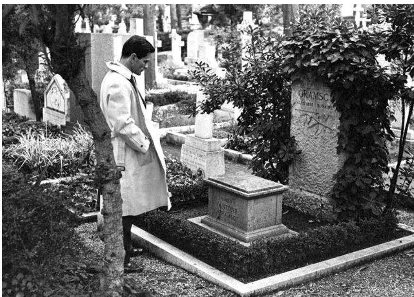
Na grobu Antonija Gramšija (1891–1937), Rim, 1957.