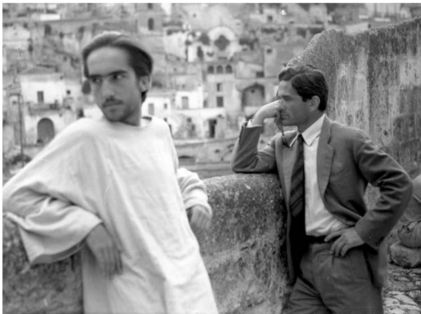
Pazolini i Enrike Irazoki (Enrique Irazoqui, 1944), u mestu Sassi di Matera (južna Italija), na snimanju filma Il Vangelo secondo Matteo , 1964.

na, granitna kapija, bela, kao i ceo grad. I sada, pošto se čak i u Adenu saobraćaj malo pojačao – posle oslobođenja od vladavine emira, itd. – tamo ima nešto više kamiona, za koje je ta kapija preuska. I oni su je digli u vazduh – i bili tako ponosni zbog toga što su razneli tu čudesnu kapiju! Svečano su objavili kako je „revolucija oslobodila Al Mukalu od tog tereta prošlosti“.