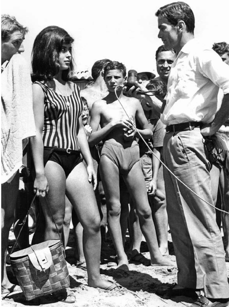
Comizi d'amore (Ljubavni susreti, 1964)

tav u prašini, kao napušteni Laj 19 – druga mogućnost ne postoji. Prema tome, razumevanje je ono najmanje što se može učiniti. A čin se može sastojati samo iz toga da se napadne sin, upravo zato da bismo na kraju ostali da ležimo mrtvi u prašini. 20 Gledam te sinove, pokušavam da ih razumem, i na kraju preduzimam nešto; delujem tako što im govorim ono za šta verujem da je istina o njima: