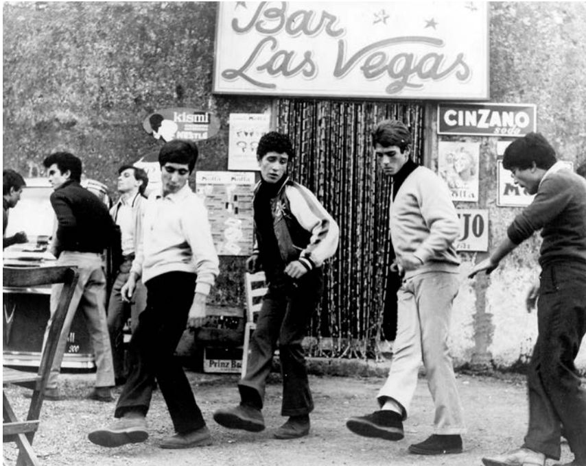
Uccellacci e uccellini, 1966.

Čovek od kulture, dragi Denarijelo, može biti samo ili daleko ispred ili daleko iza svog vremena (ili oboje u istom mah; kao u mom slučaju).