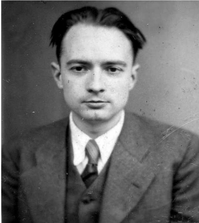
Jacques Ellul (1912–1994), Bordo, 1944.