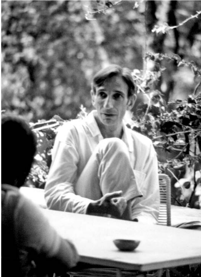
Ivan Illich, Cuernavaca, 1974.

pripisuju supsistenciji – supsistenciji koju ekonomski rast neminovno razara – iste one zbog kojih rast mora ići dalje. To sentimentalno sažaljenje transformiše supsistenciju u senku ekonomije. Ono izlazi na kraj s aparthejdom, koji se zasniva na suprotnosti između proizvodnje i potrošnje, tako što manipuliše nostalgijom za supsistencijom. Sentimentalno veličanje žrtava aparthejda – žena, pacijenata, crnaca, nepismenih, nerazvijenih, narkomana, autsajdera i proletera – pruža čoveku mogućnost da svečano protestuje protiv sile pred kojom se već kapituliralo. Takva sentimentalnost je nepoštenje kojeg se društvo, koje je izvršilo nasilje nad sredinom koja mu omogućava supsistenciju, ne može odreći. Takvo društvo je upućeno na uvek novo dijagnosticiranje onih koje mora zbrinjavati. A to pokroviteljsko nepoštenje omogućava predstavnicima potlačenih da teže ka moći za novo i dalje tlačenje.