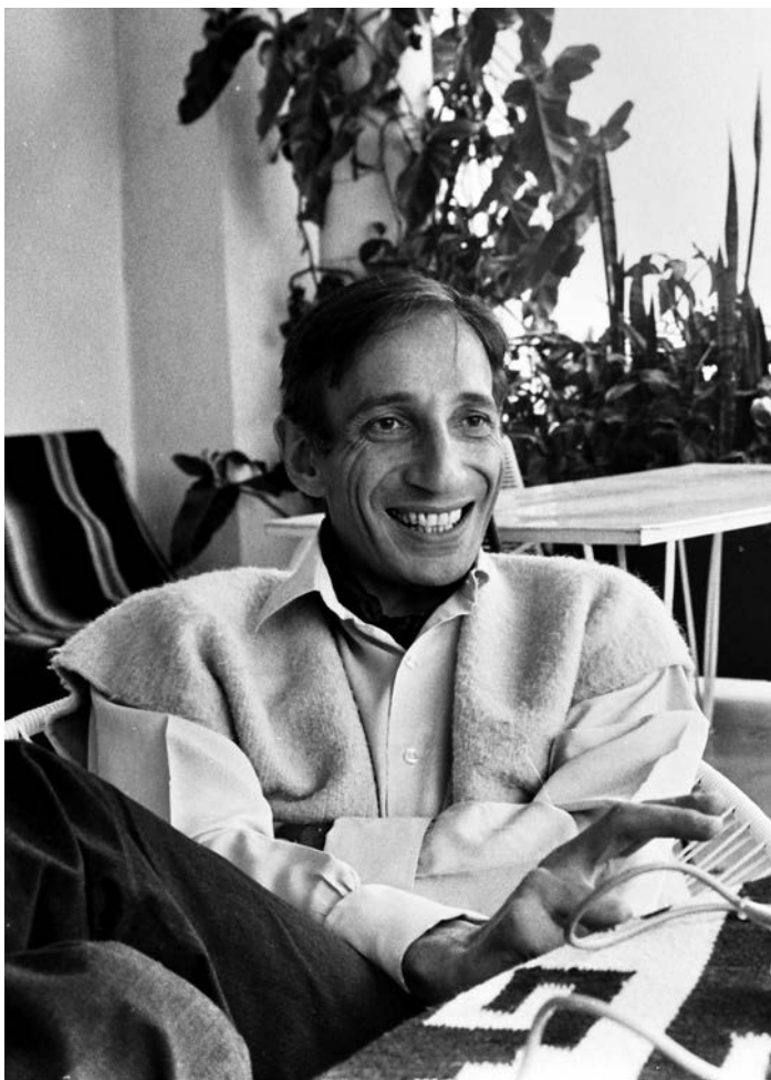
Ivan Illich (1926–2002)