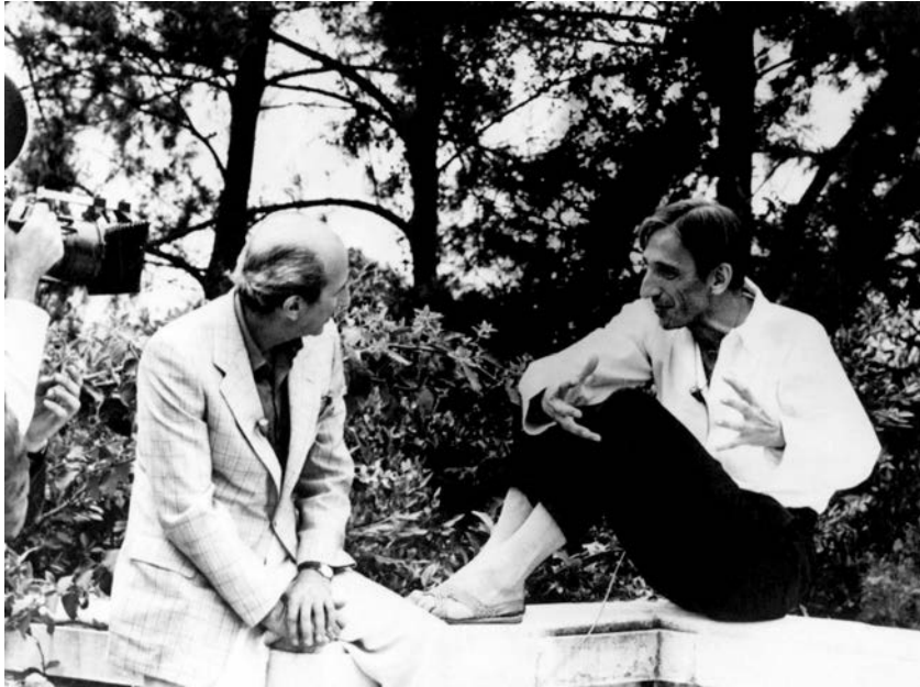
Giulio Macchi i Ivan Illich, 1973.

Ovaj tekst je prvi put objavljen u Mondu , početkom 1973. Za vreme ručka u Parizu, ugledni urednik tog dnevnog lista je, prihvativši rukopis, predložio samo jednu izmenu. Smatrao je da za jedan tako malo poznat i tehnički izraz, kao što je „energetska kriza“, nema mesta u prvoj rečenici članka koji bi bio objavljen na strani 1. Kada danas čitam tekst, zapanjen sam brzinom pomaka do kojeg je u poslednjih pet godina došlo u jeziku i samom tom pitanju. Kao što me zapanjuje i spori, ali postojan tempo u kojem radikalna alternativa industrijskom društvu – naime, niskoenergetski, konvivijalni moderitet – stiže svoje zagovornike.