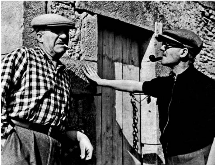
Leže i Korbizje, 1937.

„Pođite na odmor sa istim ljudima. Dvesta pređenih kilometara, a sve što se promenilo je kroj pantalona. Uzmite zato svoj bicikl i zadržite se malo. Skrenite s puta, izgubite se na sporednim stazama, dođite u dodir s lokalnim stanovnicima, koji su kao vi i ja, ništa manje pametni, možda i pametniji od vas, samo na neki drugi način... Ne moramo ići u Kinu...“