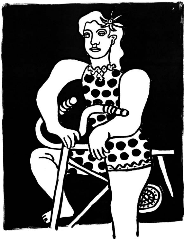
F. Léger, Cirque , 1950, str. 106.

Nekoliko crtica, delom i polemičkih – iako opet uz pomoć Ilića, odnosno njegovih kasnijih samokritičkih osvrtu – kao prilog uz bibliografiju i eventualne debate. (AG)