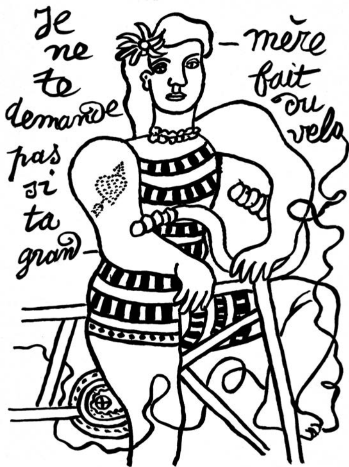
F. Léger, „Je ne te demande pas si ta grand-mère fait du vélo“, Cirque , 1950, str. 111. Naslov slike je stih iz jedne popularne pesme (Dranem, Est ce que je te demande? , 1925). Ta fraza doslovno znači „nisam te pitala vozi li tvoja baba bicikl“, u smislu, „da li sam te pitala nešto?“ ili „gledaj svoja posla“.

velika brzina automobila u suprotnosti s principom jednakog prava na pristup i korišćenje za sve, osim ako se sredstva javnog prevoza ne unaprede. 2 Novine su tome dale naslov: El socialismo sólo puede llegar en bicicleta . Socijalizam može doći samo na biciklu.