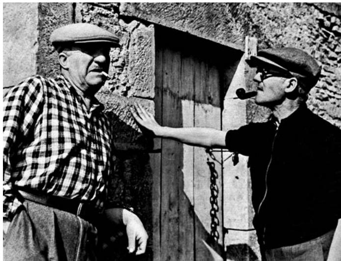
Leže i Korbizije, 1937.

„Pođite na odmor sa istim ljudima. Dvesta pređenih kilometara, a sve što se promenilo je kroj pantalona. Uzmite zato svoj bicikl i zadržite se malo. Skrenite s puta, izgubite se na sporednim stazama, dođite u dodir s lokalnim stanovnicima, koji su kao vi i ja, ništa manje pametni, možda i pametniji od vas, samo na neki drugi način... Ne moramo ići u Kinu...“