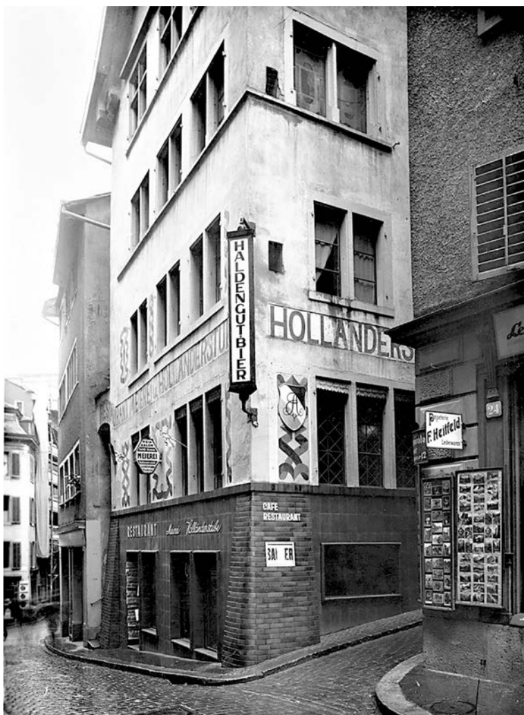
Zürich, Spiegelgasse 1, Cabaret Voltaire .