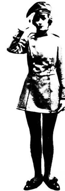
Emmy Hennings, Varieté Maxim , Zürich–Basel, 1915.