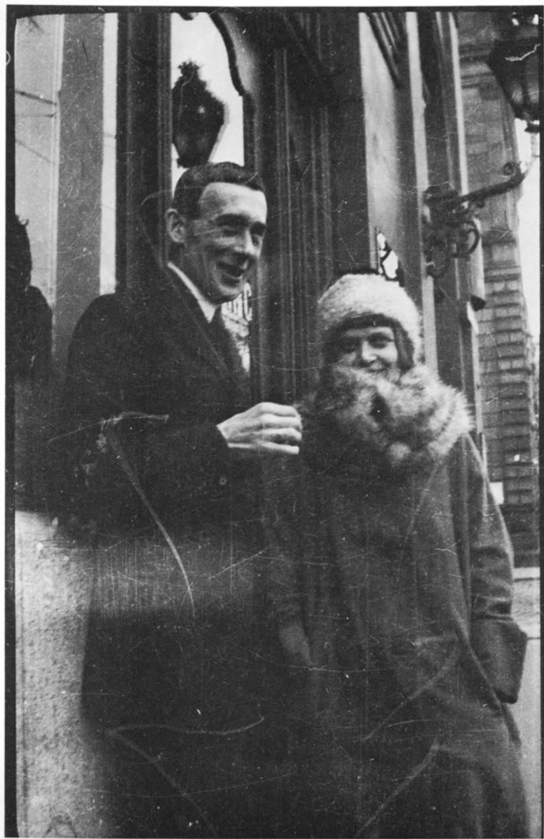
Hugo Ball i Emmy Hennings, München, 1915.