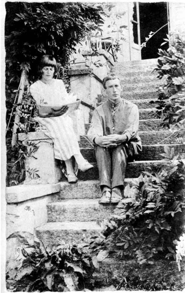
Emmy Hennings i Hugo Ball, Agnuzzo, 1920–1921.

Odlomak iz uvoda Džona Elderfilda, za prvo izdanje Balovog dnevnika na engleskom jeziku (1974)