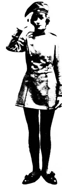
Emmy Hennings, Variété Maxim , Zürich–Basel, 1915.