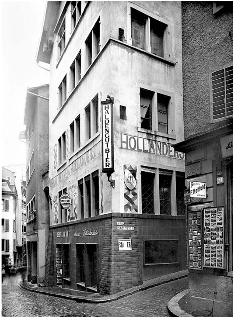
Zürich, Spiegelgasse 1, Cabaret Voltaire .