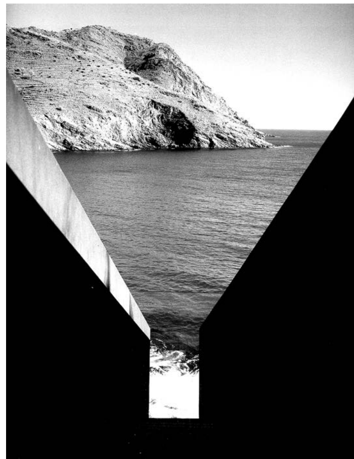
Pasazi , spomenik Walteru Benjaminu. Dani Karavan (1994), Portbou, Katalonija (Španija).