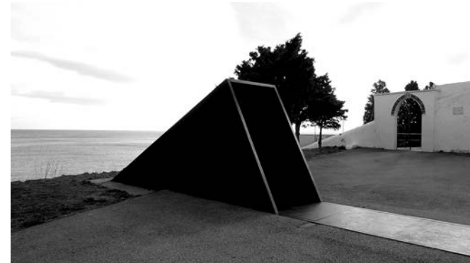
Pasaži , spomenik Walteru Benjaminu. Dani Karavan (1994), Portbou, Katalonija (Španija).

Paralipomena uz teze „O shvatanju istorije“ 21