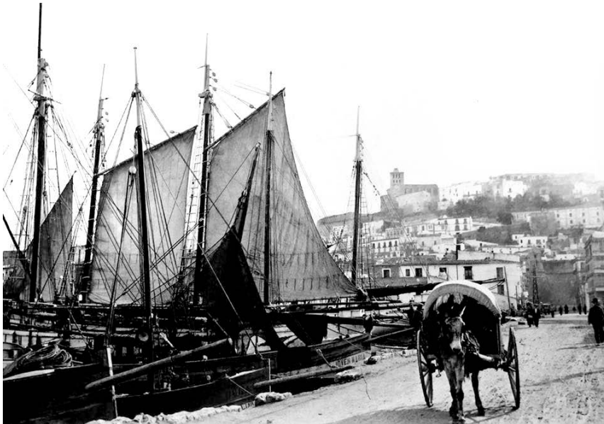
Ibiza (Eivissa), c. 1920.