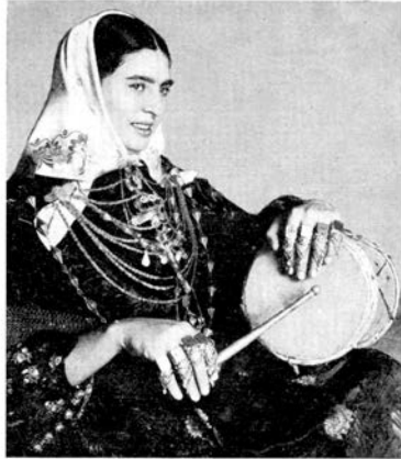
LA ISLA BLANCA