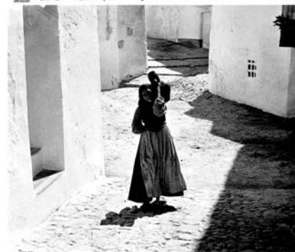
IBIZA - 18 serie Nº 5 - Un apunte típico

nego ikad, ali sada je tu, pored njega, i nešto izrazito „južnjačko“, odnosno mnogo trezvenije ličan i telesan nego što je njegova visokoparna mlada-lučka metafizika ikada bila, koji je u potpunosti uvažavao neposrednu sadašnjost, kroz novi oblik deskripcije, u isti mah čulan i meditativan, alegorijsku reportažu. Pejzaž koji evocira, u njegovoj elementarnoj i činjeničnoj punoći, bogat je znacima i istorijskim svedočanstvima. Kao i velegradske ulice kojima je voleo da luta, „Tlo ovde odjekuje nekako šuplje... (i) uzvraća na svaki korak...“ Tako čak i na devičanskoj Ivisi, Benjamin ostaje u svom prirodno-istorijskom svetu slika. (...)