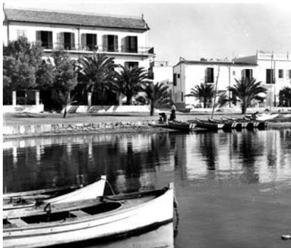
IBIZA - 18 serie Nº 12 - San Antonio Abad. - Hotel Portmany