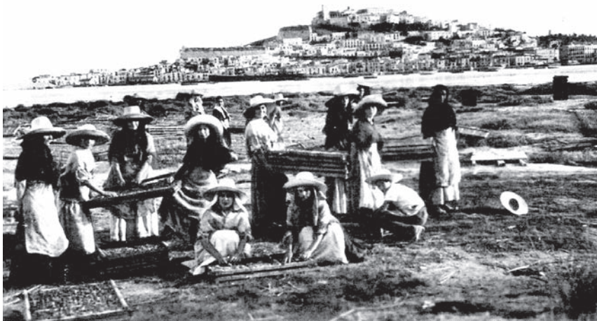
Ibiza (Eivissa), c. 1930.

Sve se menja i zamenjuje mesta; ništa ne ostaje i ništa ne nestaje. Iz celog tog tkanja, međutim, odjednom izranjaju imena; bez reči ulaze u misli prolaznika i dok ih oblikuje usnama, on ih prepoznaje. Izlaze na površinu. Šta bi još mogao očekivati od tog predela? Ona prolaze pokraj njega na dalekom, bezimenom horizontu, ne ostavljajući za sobom ni traga. Imena ostrva, koja izranjaju iz mora kao mermerni kipovi, okomite stene, čiji vrhovi krune horizont, zvezde koja ga iznenade u čamcu, kada s prvim mrakom izađu na stražu. Pisma zrikavaca je utihnula, žeđ je prošla, dan se gasio. Iz dubine polja se podiže neka larva. Lavež, odron kamenja, dozivanje iz daljine? Dok osluškuje, pokušavajući da odgonetne taj zvuk, u njega počinje da se uvlači brujanje zvona, notu po notu. Onda ga obuzima i širi se u njegovoj krvi. Ljiljani koji cvetaju u uglu živice od kaktusa. U daljini, bešumno truckanje neke zaprege, koja ide poljem između stabala maslina i badema; a kada točkovi nestanu iza lišća, žene, veće od života, lica okrenutih ka njemu, kao da lebde, nepomične, u nepomičnom predelu.