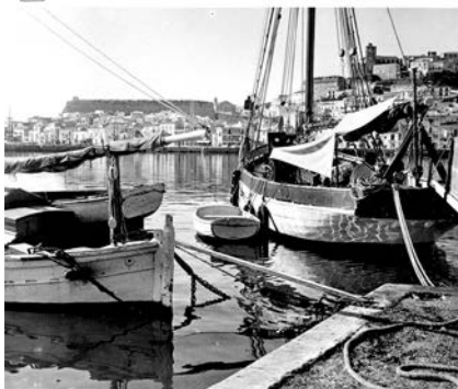
IBIZA - 18 serie Nº 7 - Puerto - Detalle