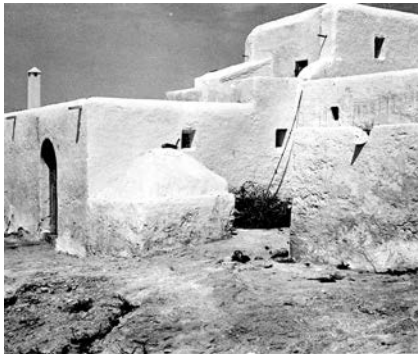
IBIZA - 18 serie Nº 14 - Casa típica