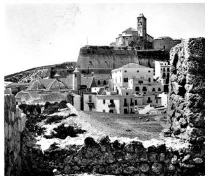
IBIZA - 18 serie Nº 2 - Vista parcial y Catedral