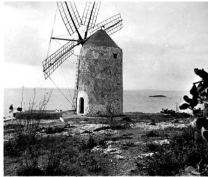
IBIZA - 18 serie Nº 10 - Molino típico