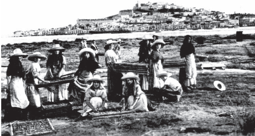
Ibiza (Eivissa), c. 1930, foto Domingo Viñets.

Sve se menja i zamenjuje mesta; ništa ne ostaje i ništa ne nestaje. Iz celog tog tkanja, međutim, odjednom izranjaju imena; bez reči ulaze u misli prolaznika i dok ih oblikuje usnama, on ih prepoznaje. Izlaze na površinu. Šta bi još mogao očekivati od tog predela? Ona prolaze pokraj njega na dalekom, bezimenom horizontu, ne ostavljajući za sobom ni traga. Imena ostrva, koja izranjaju iz mora kao mermerni kipovi, okomite stene, čiji vrhovi krune horizont, zvezde koja ga iznenade u čamcu, kada s prvim mrakom izađu na stražu. Pesma zrikavaca je utihnula, žeđ je prošla, dan se gasio. Iz dubine polja se podiže neka larva. Lavež, odron kamenja, dozivanje iz daljine? Dok osluškuje, pokušavajući da odgonetne taj zvuk, u njega počinje da se uvlači brujanje zvona, notu po notu. Onda ga obuzima i širi se u njegovoj krvi. Ljiljani koji cvetaju u uglu živice od kaktusa. U daljini, bešumno truckanje neke zaprege, koja ide poljem između stabala maslina i badema; a kada točkovi nestanu iza lišća, žene, veće od života, lica okrenutih ka njemu, kao da lebde, nepomične, u nepomičnom predelu.