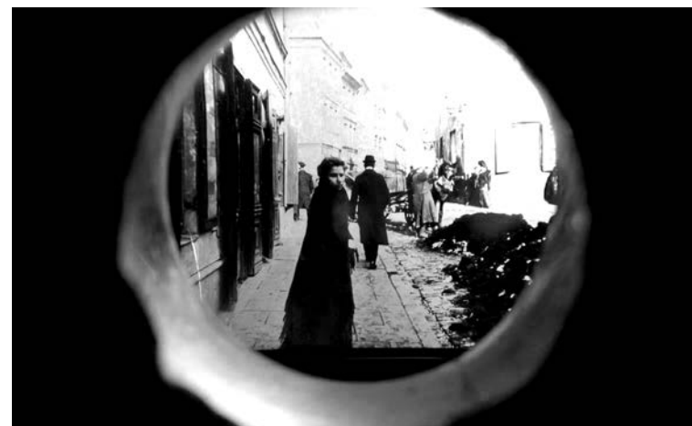
Stereoskopska fotografija iz varšavskog „Fotoplastikona“ (1905?).

Naslov teksta aludira na „Carsku panoramu“, Keiserpanorama , uređaj koji je 1880. godine patentirao nemački fizičar i preduzetnik August Furman (August Fuhrmann, 1844–1925). Sastojao se iz velikog bubnja, sa unutrašnjim rotacionim mehanizmom, sličnim satnom, koji je prikazivao stereoskopske fotografije, urađene na staklu i često retuširane, s naglašenim efektom dubine (rane „3D“ slike i preteča filma). Publika je sedela oko bubnja, po nekoliko posetilaca u isto vreme, i posmatrala prizore kroz par stereoskopskih sočiva. Uređaj je bio veoma popularan u nemačkim zemljama (u Poljskoj je praktično ista aparatura patentirana pod nazivom „Fotoplastikon“, pored sličnih atrakcija konstruisanih u Francuskoj, SAD i drugim zemljama), sve do približno 1910, iako nije bio odmah potisnut pojavom filma.