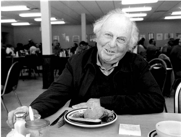
Marshall Sahlins, Manny's Coffee Shop and Deli, Čikago, 2004.

Večernja zabava koju je Maršal Salins priredio na Četvrtoj decenijskoj konferenciji Udruženja socijalnih antropologa Komonvelta, u Oksfordu, 29. jula 1993.