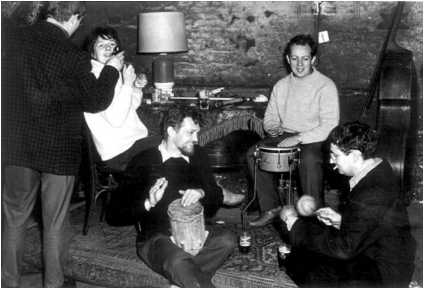
J. V. Martin, Raoul Vaneigem i Guy Debord, novembar 1962.