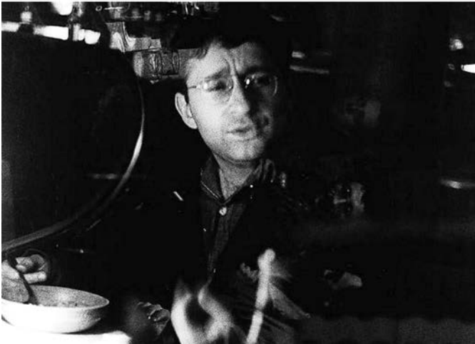
Guy Debord, 1962.