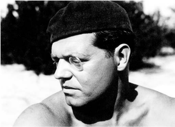
Raoul Hausmann, 1930.