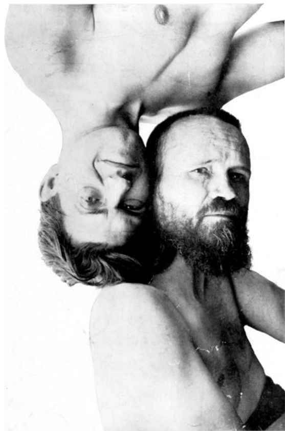
John Heartfield: Dupli portret Johannes Baadera i Raoula Hausmanna, c. 1919–20.

Oberdada Bader je pre svega zbijao šale, koje su ponekad, slučajno, bile na liniji pobune. Tako je jednom upao u Narodnu skupštinu u Vajmaru (16. VII 1919), i prekinuo zasedanje, zahtevajući da vladu zameni dadaistička grupa, i razbacujući okolo svoj pamflet „Zeleni leš (Grüne Leiche)“, koji je najavljivao dolazak Badera na belom konju, kao vrhovnog sudije Sudnjeg dana, i pretio da će dići parlament u vazduh.