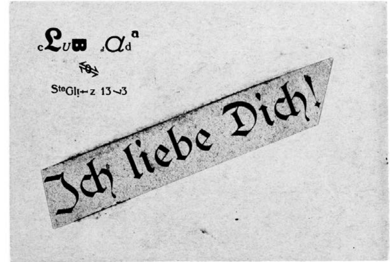
Hausmanova dopisnica za Hanu Heh, od 29. IX 1918.

komponovao atonalnu simfoniju iz tri dela, pod naslovom „Antisimfonija (Muzička cirkularna giljotina)“, koju je izvela mlada devojka u beloj odori. 14 Kontrast između te pojave i napada čudnih zvukova bio je tako veliki, da je publika ostala nema.