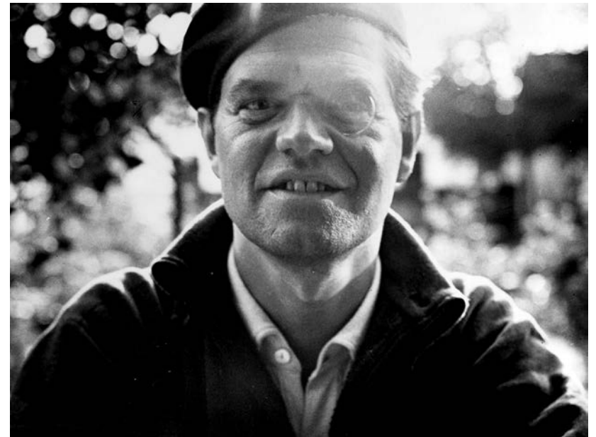
Raoul Hausmann Beč, 12. VII 1887. – Limož, 1. II 1972.

très relatif, d'n'est pas Jésus, vraiment!