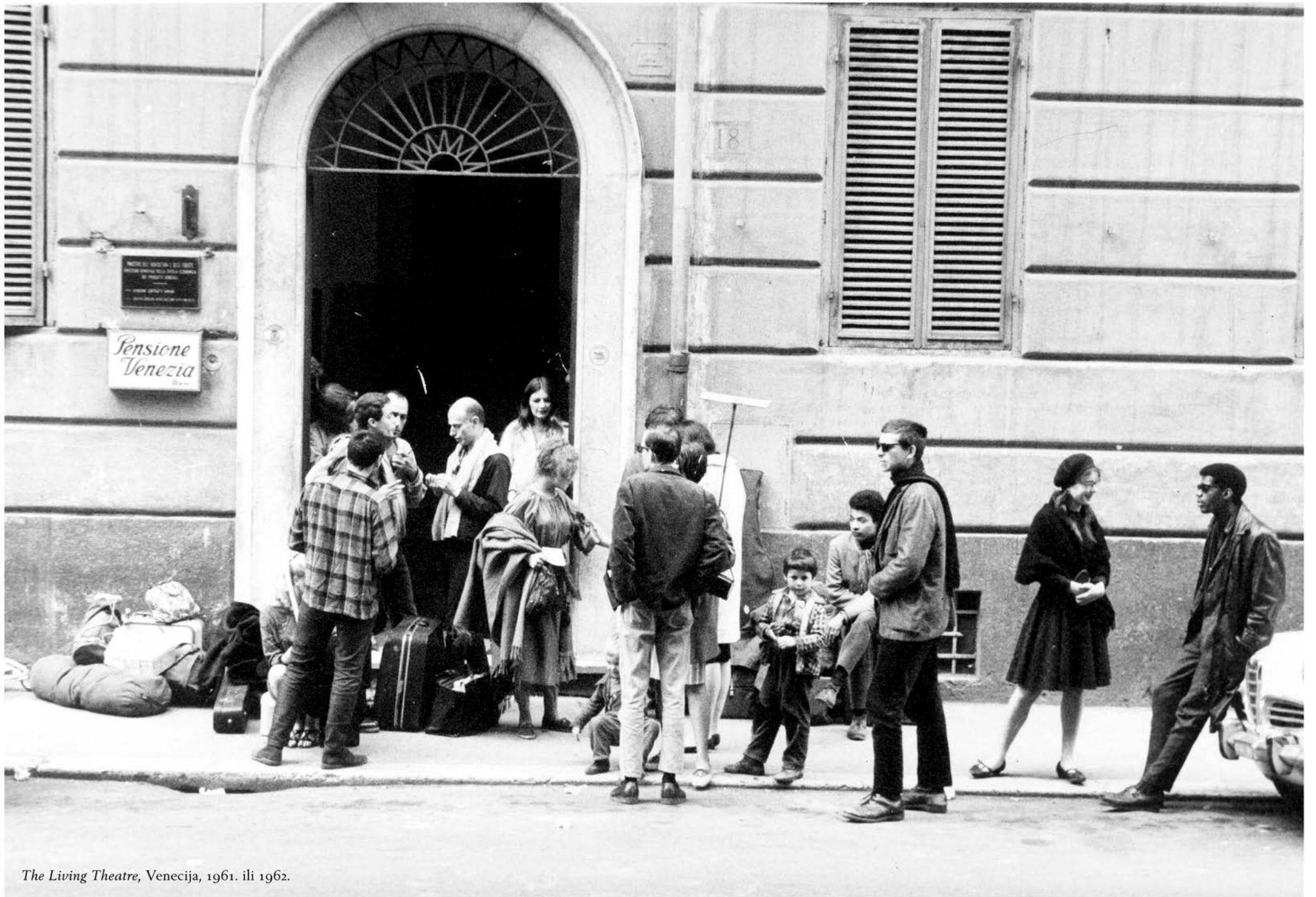
The Living Theatre, Venecija, 1961. ili 1962.