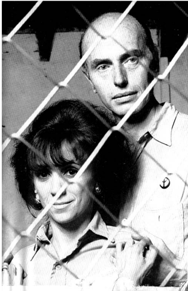
Judith Malina i Julian Beck, u vreme predstave The Brig (Zatvor), 1963.