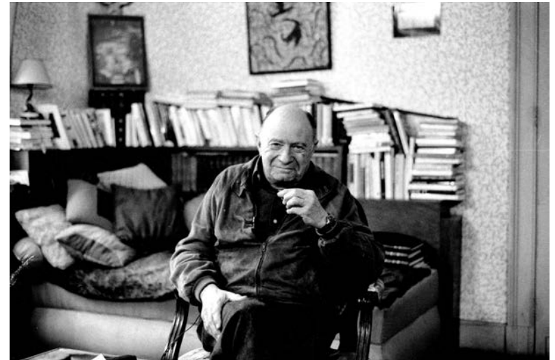
Žak Elil, u svojoj kući u Pesaku (Pessac), nadomak Bordoaa, za vreme snimanja dokumentarca The Betrayal by Technology , 1990 (1992).