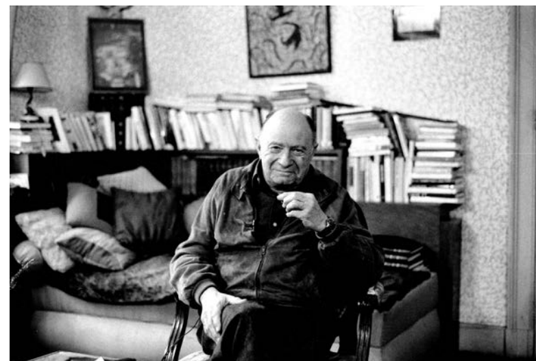
Žak Elii, u svojoj kući u Pesaku (Pessac), nadomak Bordoaa, za vreme snimanja dokumentarca The Betrayal by Technology , 1990 (1992).

Sve ovo što sam rekao, naravno, ne zvuči mnogo efikasno. Kada se suprotstavljamo nečemu što je suviše efikasno, moramo nastojati da NE budemo još efikasniji. Naime, pokazaće se da to nije najefikasniji način.