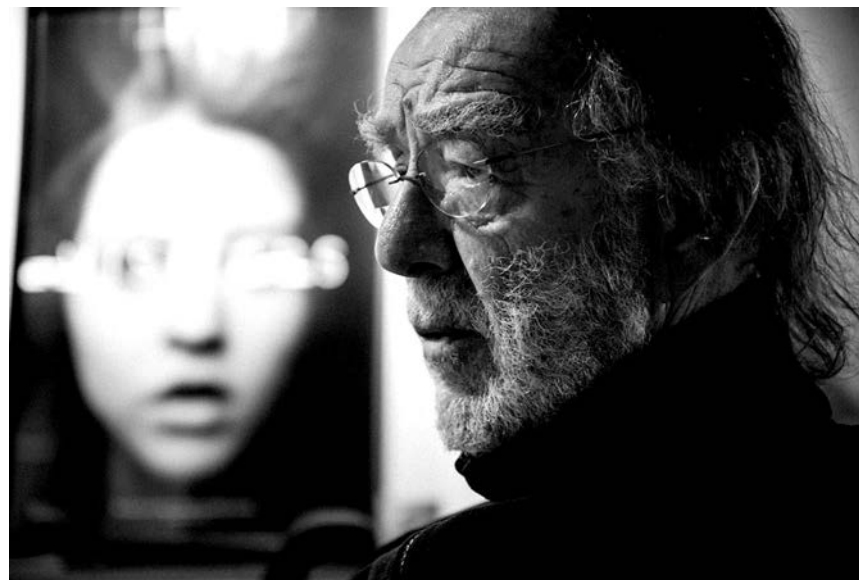
G. Reggio, New York, januar 2014.

REGGIO: Ne, nisam bio. Nisam nikada bio takav, zaista. Ja sam veoma neurotična osoba. Nekako sam i spiritualna osoba, ali mislim da to nije isto što i religioznost. S druge strane, mislim da je svakome od nas potrebna zajednica, a religija je stvar zajednice. To nije stvar dogme već življenja u zajednici s drugim ljudima, s ljubavlju kao glavnom sponom. Po meni, ono što jesmo jeste naša duša. U tome je stvar i sa muzikom. Muzika je gospa Atmos; to je ezoterično ime atmosfere. To je ono što udišemo, što nas okružuje. Dolazim iz Nju Orleansa, kao dete i adolescent rastao sam uz muziku, sve do trinaeste godine, kada sam napustio dom. To je ono što čini duh. Sada bih hteo da postavim jednu zagonetku: mi smo, u isti mah, i duh i materija. Siguran sam da duh prati materiju, ali mi smo nešto daleko više od svoje materijalnosti, nosimo još nešto duboko u sebi, što nazivamo „dušom“ ili kako je kome drago. Hoću da kažem, nije važno kako to zovete, zato što je to, u krajnjoj liniji, s one strane... to