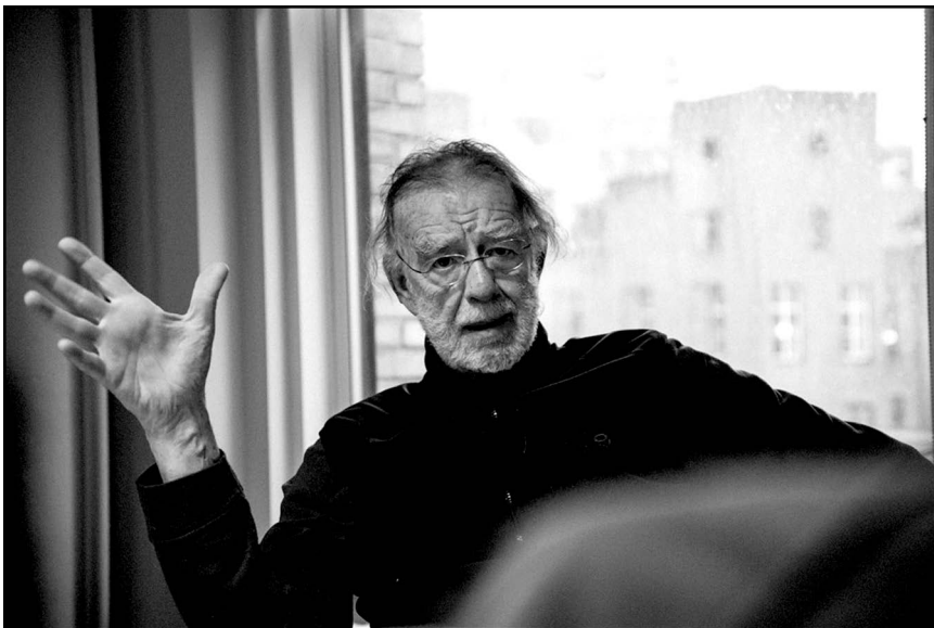
G. Reggio, New York, januar 2014.

da najviše možemo napraviti kroz pružanje primjera, ne samo riječima, već služeći se onim riječima iza kojih možemo stati s onim što radimo. Živjeti u svijetu, ali ne biti dio tog svijeta, biti odmetnik, ali znati da smo svi unutra. Živjeti sa zagonetkom da život nije ovo ili ono, nego da je život i ovo i ono. Da nije crn ili bijel, već da je i crn i bijel. Tom bih receptu dodao i malo humora i eto kako bi se pojedinac mogao naći u prilici živjeti smislenim životom.