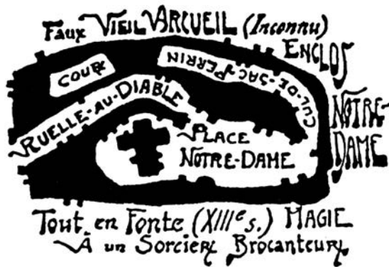
Satijev imaginarni plan „Lažnog starog (nepoznatog) Arkeja“, 1909.