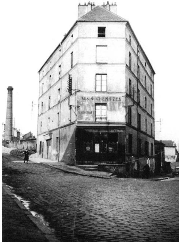
Pansion „Kod četiri dimnjaka“, u Arkeju, u kojem je Sati proveo poslednje tri decenije života.

Satievo viđenje pisanja zapadne buržoaske štampe o revoluciji u Rusiji 1917–1922. Originalno bez naslova, neobjavljen tekst, napisan za dadaistički časopis „Les Feuilles libres“, oko 1922.