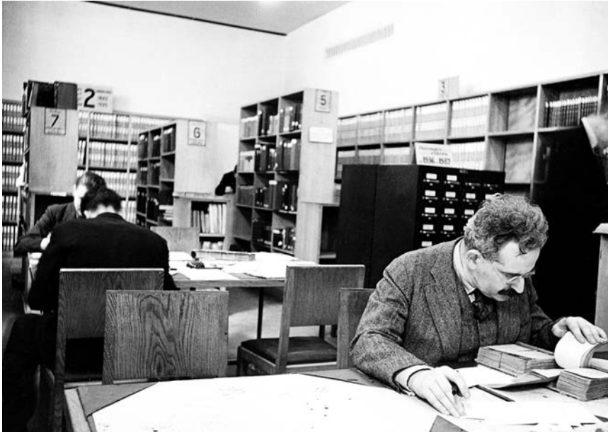
Walter Benjamin, Bibliothèque Nationale, Paris, 1937.