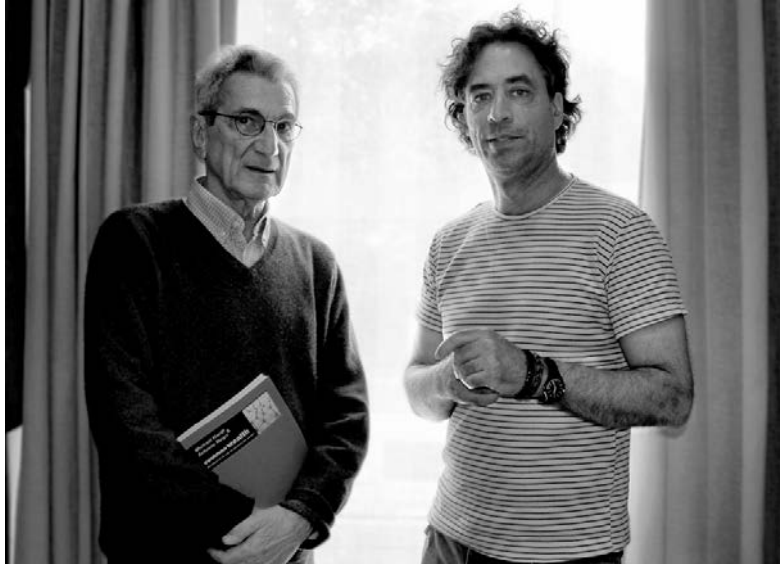
A. Negri i M. Hardt, na promociji još jedne zajedničke knjige, Commonwealth (Harvard University Press, 2009), u Madridu, 2011.