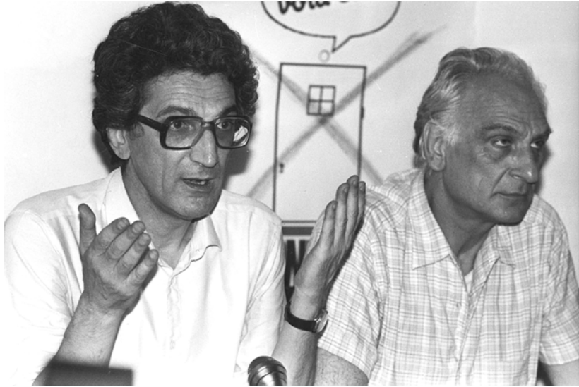
A. Negri i Marco Pannella, lider Radikalne partije (Partito Radicale), 1983.

čela sudska odiseja Tonija Negrija, koji je 7. aprila 1979. bio uhapšen s još nekoliko desetina aktivista, u policijskoj akciji usmerenoj na šire okruženje Radničke autonomije. Podignuta je optužnica zbog subverzivnog udruživanja i povezivanja u oružanu grupu, ali u narednih nekoliko meseci, optužnice protiv Negrija počele su da se umnožavaju, sve dok nisu uključile i pobunu protiv države, kidnapovanje i ubistvo demohrišćanskog lidera Alda Mora i još 17 ubistava (te optužbe su bile povučene u narednih nekoliko godina). Bile su to godine u kojima su „priznanja“ pokajnika i posebni zakoni koje je inicirao ministar unutrašnjih poslova Kosiga, napunili zatvore hiljadama aktivista, što je izazvalo snažne društvene tenzije.