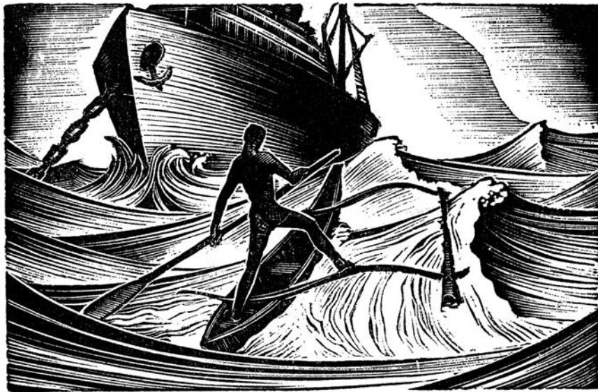
Lynd Ward, duborez za knjigu Aleca Waugha, Hot Countries (1930)

Moreplovstvo je starije od istorije; ono prethodi pripitomljavanju i civilizaciji nekoliko stotina hiljada godina. Ljudi su uveliko plovili okeanima mnogo pre nego što su, recimo, počeli da jašu konje. Pre