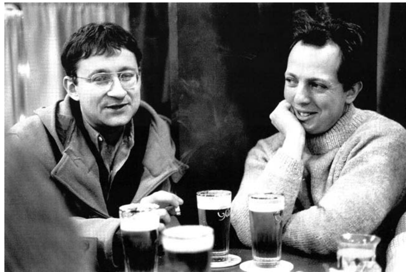
Guy Debord i Raoul Vaneigem, Pariz, 1962.

Guy Debord, za časopis Tamesis , jun ili juli 1964 (tekst je ostao neobjavljen).