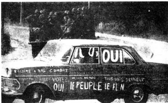
L'Algérie et l'écriture.

način. To je, u isto vreme, manifest i primer onoga što manifest nastoji da postigne. On se mora prihvatiti ili u vlastitim okvirima ili nikako.“ — Profesor Bolton